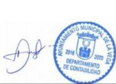
Encargado/a de Contabilidad

Certifico que esta nómina de pago consta de 3 hojas, está correcta, que las personas enumeradas en la misma han sido legalmente nombradas, y que cada una de ellas ha rendido los servicios requeridos por la ley y reglamentaciones durante el período mencionado; que dichos servicios han sido ejecutados bajo mi supervigilancia y que ninguna persona cuyo nombre consta en esta nómina es pagada por período de ausencia con exceso del que concede la ley.