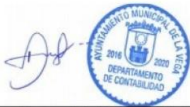
Encargado/a de Contabilidad

Certifico que esta nómina de pago consta de 67 hojas, está correcta, que las personas enumeradas en la misma han sido legalmente nombradas, y que cada una de ellas ha rendido los servicios requeridos por la ley y reglamentaciones durante el período mencionado; que dichos servicios han sido ejecutados bajo mi supervigilancia y que ninguna persona cuyo nombre consta en esta nómina es pagada por período de ausencia con exceso del que concede la ley.