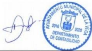
Encargado/a de Contabilidad

Certifico que esta nómina de pago consta de 3 hojas, está correcta, que las personas enumeradas en la misma han sido legalmente nombradas, y que cada una de ellas ha rendido los servicios requeridos por la ley y reglamentaciones durante el período mencionado; que dichos servicios han sido ejecutados bajo mi supervigilancia y que ninguna persona cuyo nombre consta en esta nómina es pagada por período de ausencia con exceso del que concede la ley.