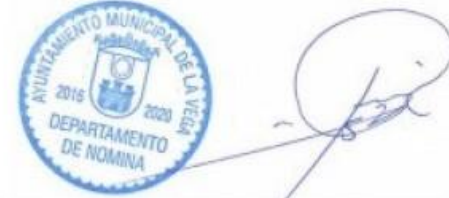
Encargado/a de Nómina