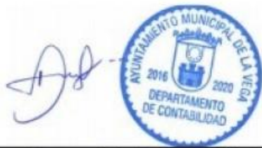
Encargado/a de Contabilidad

Certifico que esta nómina de pago consta de 2 hojas, está correcta, que las personas enumeradas en la misma han sido legalmente nombradas, y que cada una de ellas ha rendido los servicios requeridos por la ley y reglamentaciones durante el período mencionado; que dichos servicios han sido ejecutados bajo mi supervigilancia y que ninguna persona cuyo nombre consta en esta nómina es pagada por período de ausencia con exceso del que concede la ley.