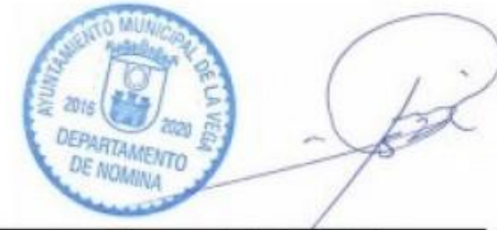
Encargado/a de Nomina