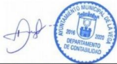
Encargado/a de Contabilidad

Certifico que esta nómina de pago consta de 5 hojas, está correcta, que las personas enumeradas en la misma han sido legalmente nombradas, y que cada una de ellas ha rendido los servicios requeridos por la ley y reglamentaciones durante el período mencionado; que dichos servicios han sido ejecutados bajo mi supervigilancia y que ninguna persona cuyo nombre consta en esta nómina es pagada por período de ausencia con exceso del que concede la ley.