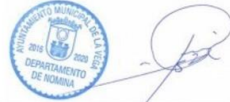
Encargado/a de Nomina