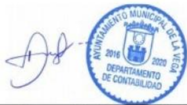
Encargado/a de Contabilidad

Certifico que esta nómina de pago consta de 3 hojas, está correcta, que las personas enumeradas en la misma han sido legalmente nombradas, y que cada una de ellas ha rendido los servicios requeridos por la ley y reglamentaciones durante el período mencionado; que dichos servicios han sido ejecutados bajo mi supervigilancia y que ninguna persona cuyo nombre consta en esta nómina es pagada por período de ausencia con exceso del que concede la ley.