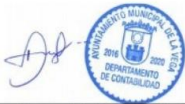
Encargado/a de Contabilidad

Certifico que esta nómina de pago consta de 10 hojas, está correcta, que las personas enumeradas en la misma han sido legalmente nombradas, y que cada una de ellas ha rendido los servicios requeridos por la ley y reglamentaciones durante el período mencionado; que dichos servicios han sido ejecutados bajo mi supervigilancia y que ninguna persona cuyo nombre consta en esta nómina es pagada por período de ausencia con exceso del que concede la ley.