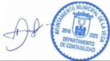
Encargado/a de Contabilidad

Certifico que esta nómina de pago consta de 2 hojas, está correcta, que las personas enumeradas en la misma han sido legalmente nombradas, y que cada una de ellas ha rendido los servicios requeridos por la ley y reglamentaciones durante el período mencionado; que dichos servicios han sido ejecutados bajo mi supervigilancia y que ninguna persona cuyo nombre consta en esta nómina es pagada por período de ausencia con exceso del que concede la ley.